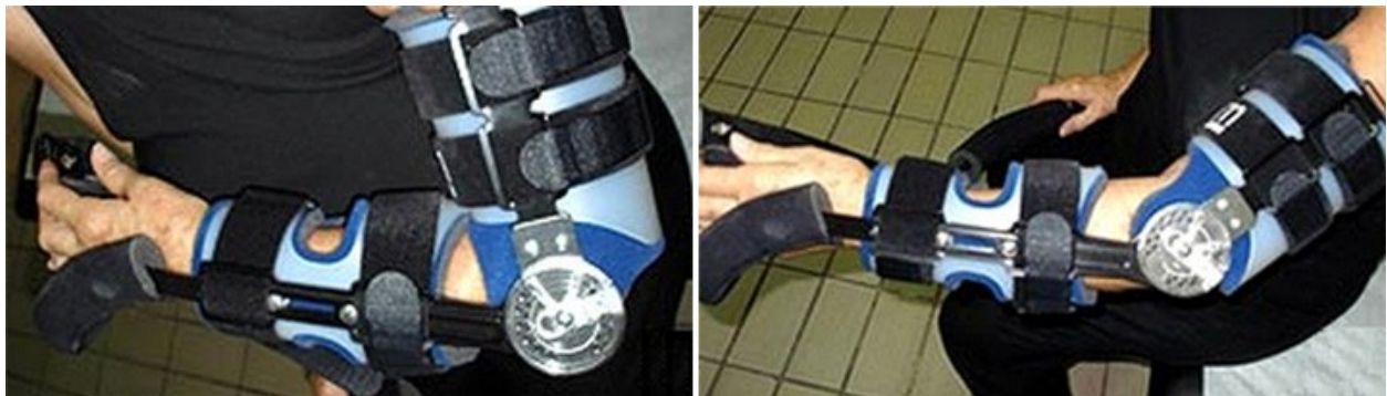
Εφαρμογή λειτουργικού νάρθηκα που επιτρέπει κίνηση στην άρθρωση του αγκώνα για την αντιμετώπιση κατάγματος της κεφαλής της κερκίδας.