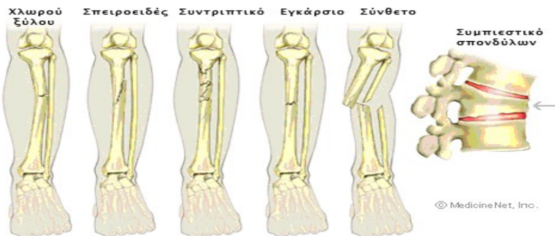
Συνηθη κατάγματα των οστών