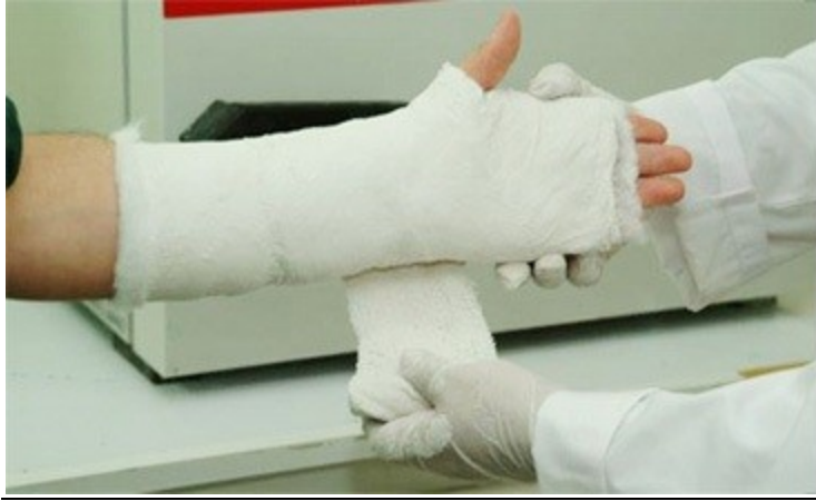
Κλινική εφαρμογή γύψινου επίδεσμου σε κάταγμα πηχεοκαρπικής και ακτινολογική απεικόνιση.